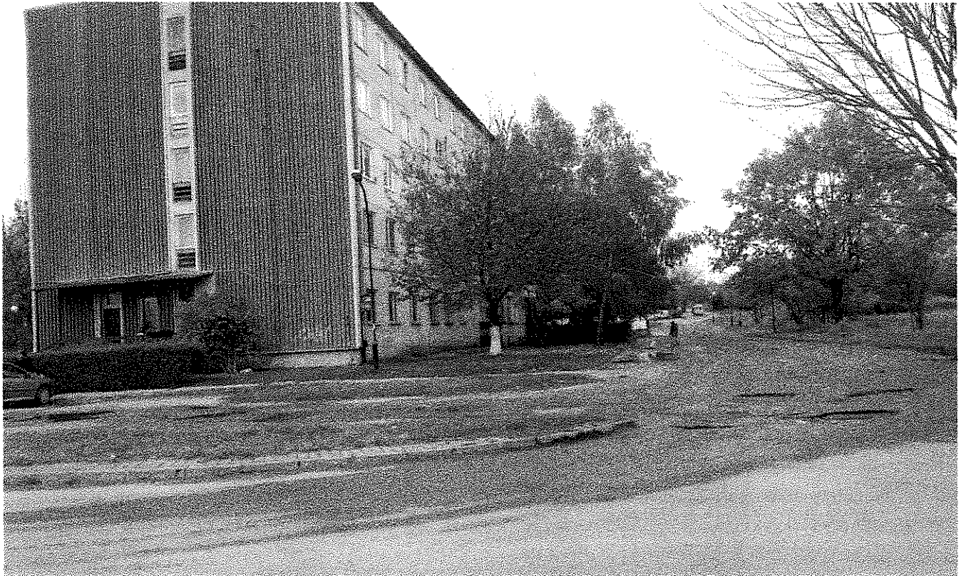
Fot. 2. Skrzyżowanie ulic B. Wapowskiego i J. Samsonowicza z nieruchomością Samsonowicza 65.