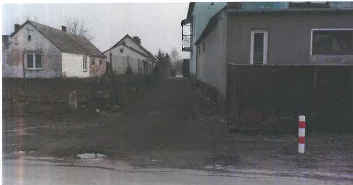
Fot. 1. Wjazd do nieruchomości przy ulicy Krężnickiej; widok na działkę nr 157, arkusz 1, obręb 50.