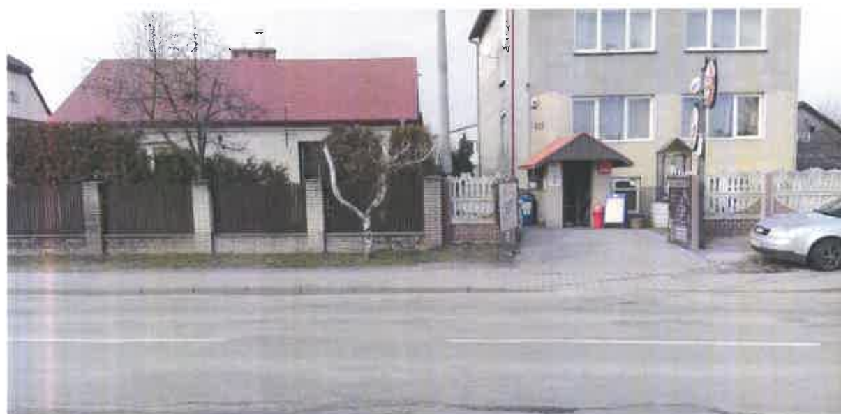
Fot. 3. Nieruchomości położone przy ulicy Krężnickiej 117 i 119.