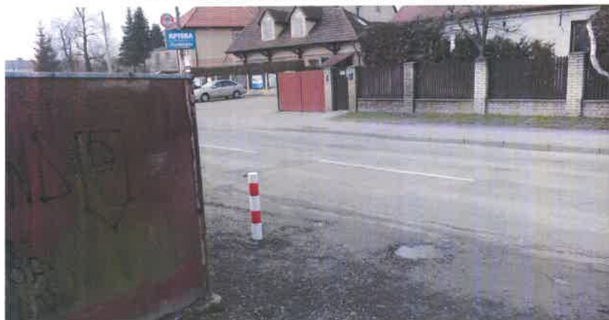
Fot. 2. Ograniczona widoczność wyjazdu na ulicę Krężnicką.