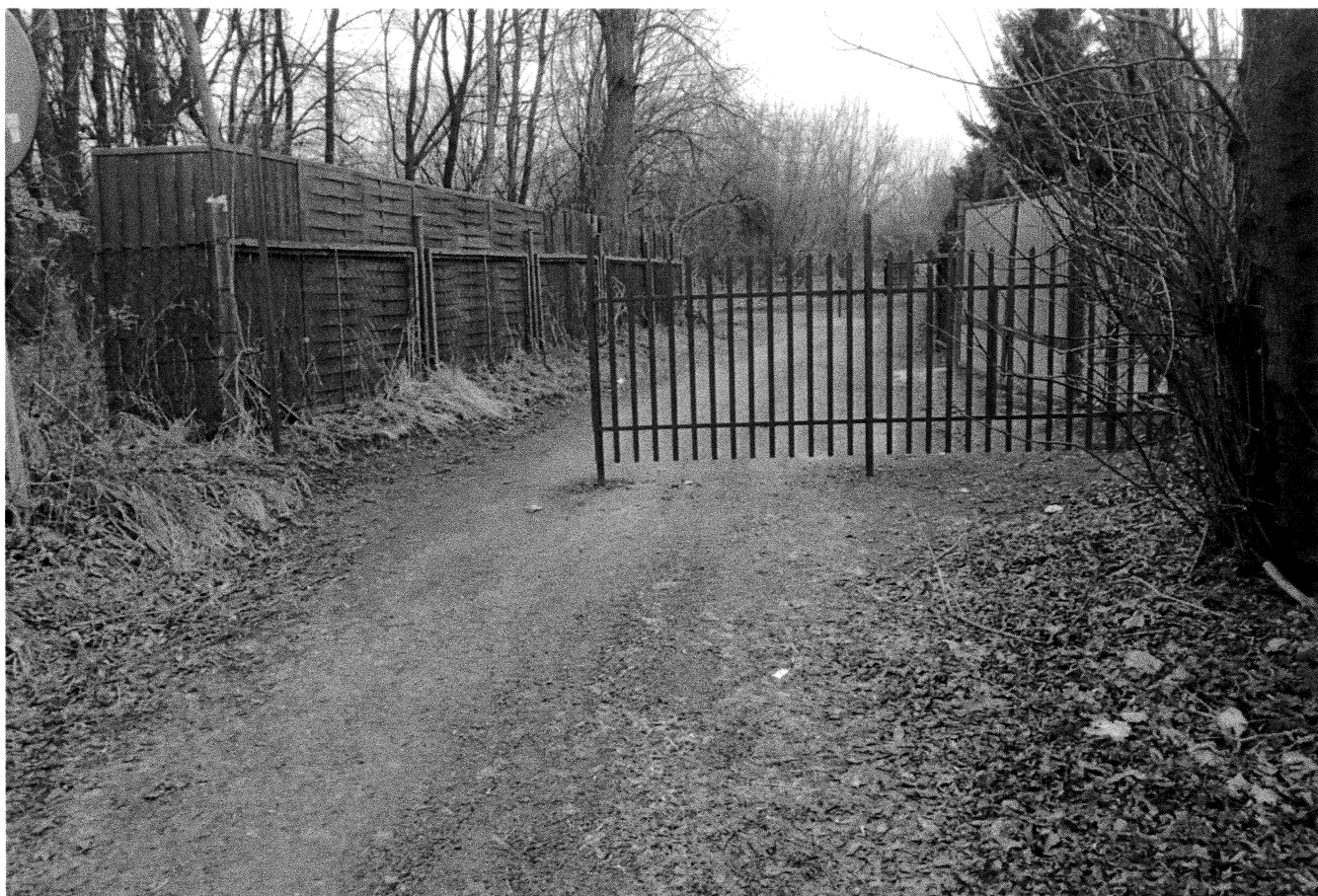
Fot. 1. Ogrodzenie działki nr 51/1, arkusz 3, obręb 49