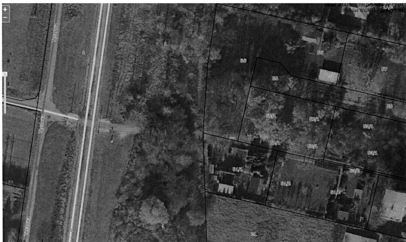
Fot. 2. Podział nieruchomości w okolicach ulicy Zagajnikowej.