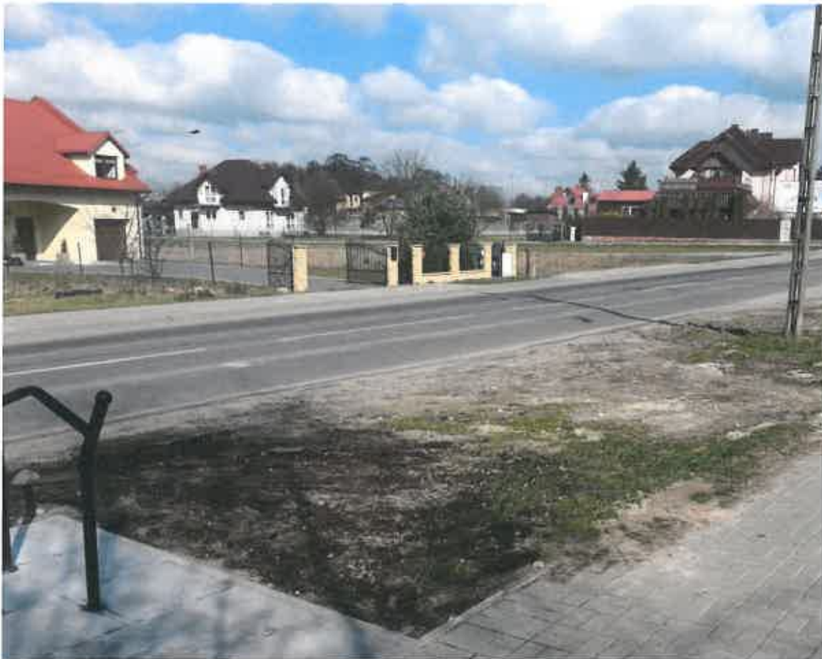
Fot. 1. Proponowane miejsce na wykonanie zatoki postojowej dla samochodów obsługujących stację roweru miejskiego i utrzymujących plac zabaw.