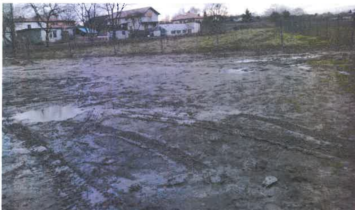
Rys. 3. Widok na plac manewrowy stanowiący początek dojścia do ścieżki rowerowej wzdłuż rzeki Bystrzycy, stan na dzień 28.01.2016 r. (działka nr 12/18 arkusz 5, obręb 20).