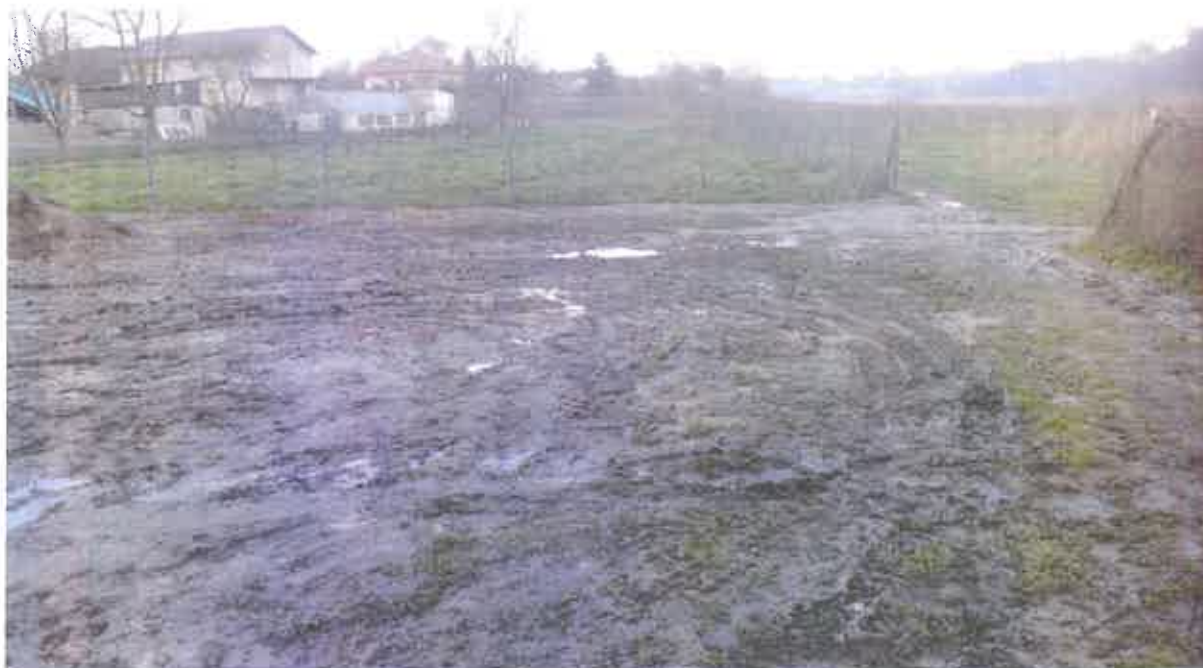
Rys. 2. Widok na plac manewrowy stanowiący początek dojścia do ścieżki rowerowej wzdłuż rzeki Bystrzycy, stan na dzień 21.11.2015 r. (działka nr 12/18 arkusz 5, obręb 20).