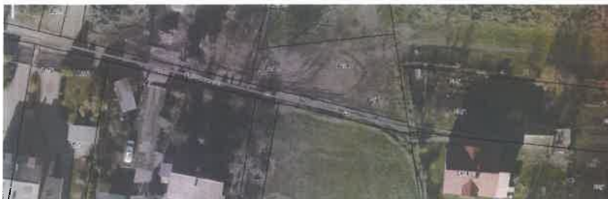
Rys. 1. Ulica Parczewska widziana z lotu ptaka (fotoplan 2014 r.).