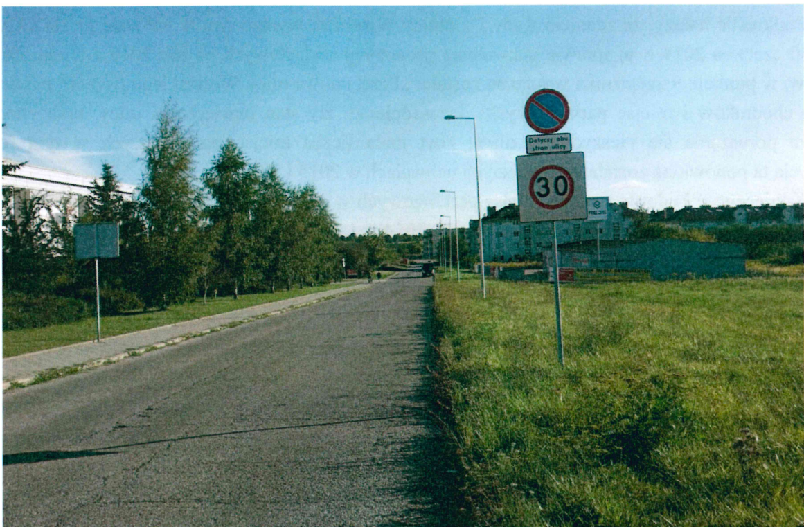
Fot. 2. Ulica Wolińskiego przy skrzyżowaniu z ulicą Diamentową.