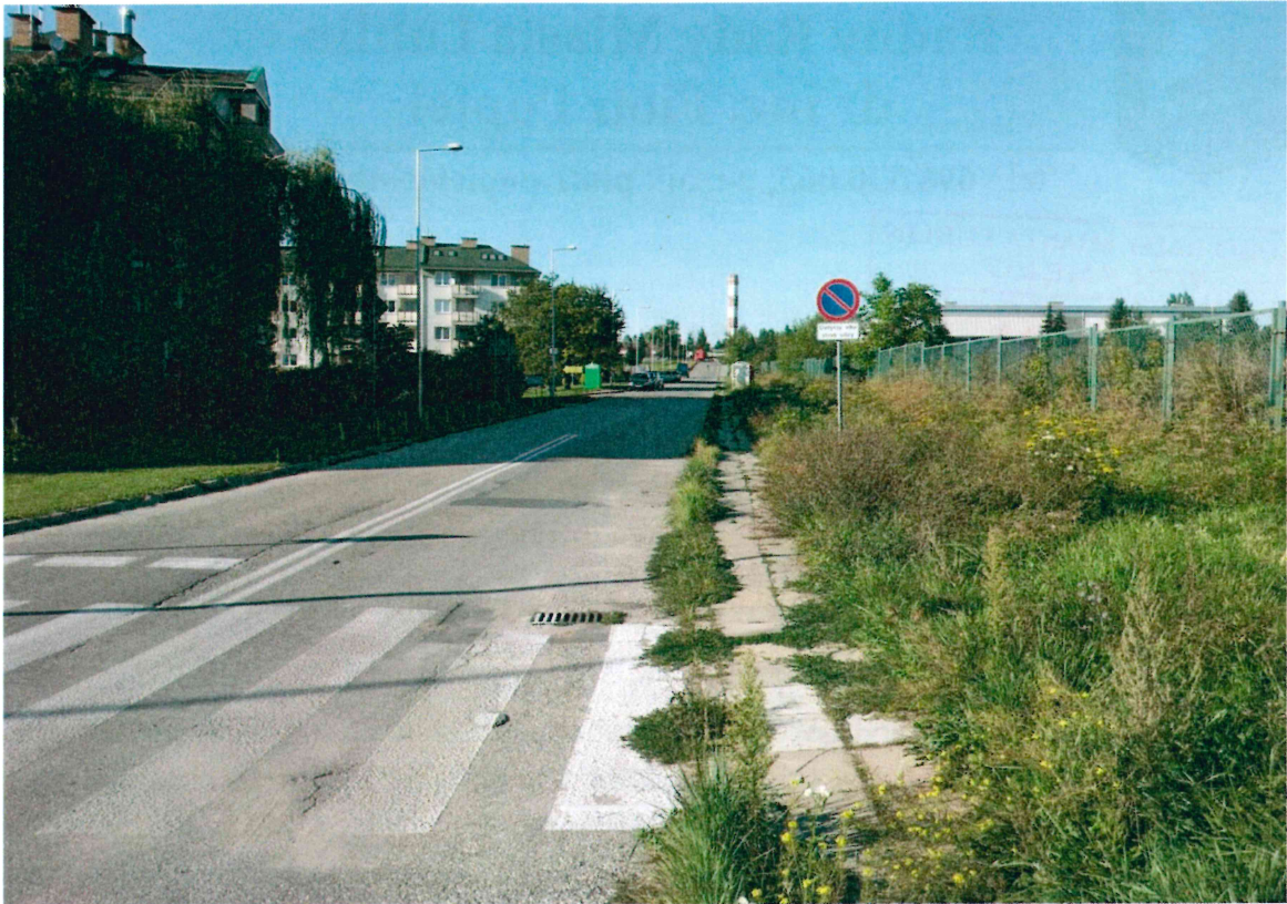
Fot. 1. Ulica Wolińskiego przy skrzyżowaniu z ulicą Wapowskiego