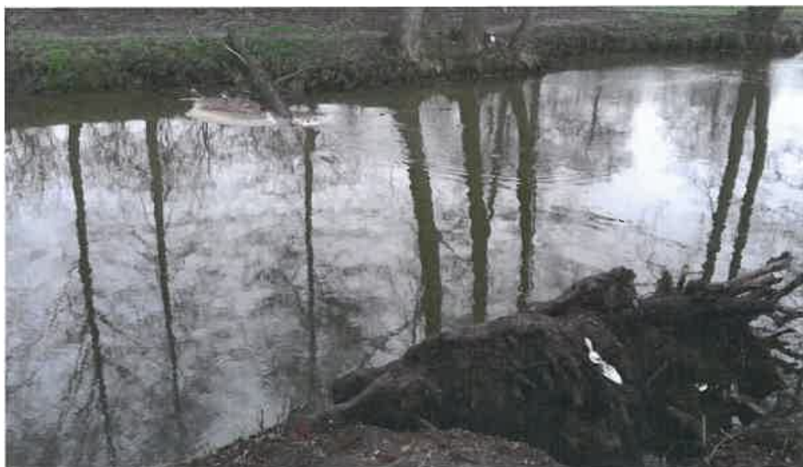
Fot. 2. Powalone drzewo w korycie Bystrzycy (na wysokości działki nr 39, arkusz 31, obręb 43), stan na dzień 01.04.2016 r.