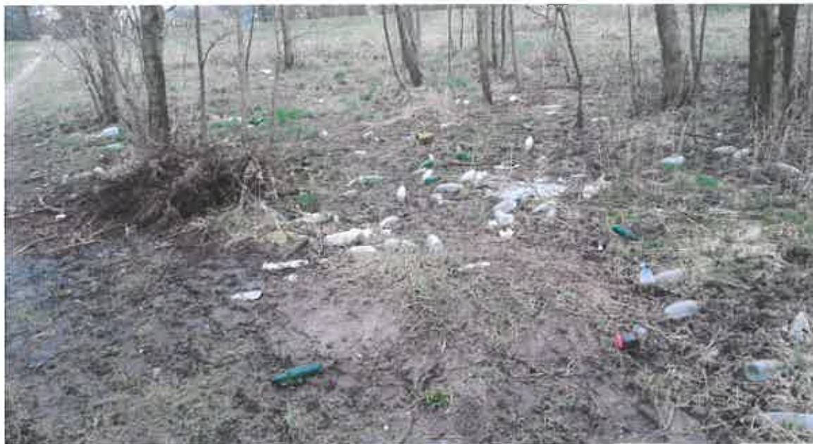
Fot. 1. Zalegające śmieci na działce nr 97/2, arkusz 14, obręb 20 – stan na dzień 01.04.2016 r.

Dziękując za współpracę pracownikom Straży Miejskiej, Wydziału Gospodarki Komunalnej, jak również lubelskiego Zarządu Dróg i Mostów w zakresie bieżącego utrzymania czystości doliny Bystrzycy zwracam się z prośbą o systematyczne monitorowanie tych miejsc przez piesze i rowerowe patrole Policji.