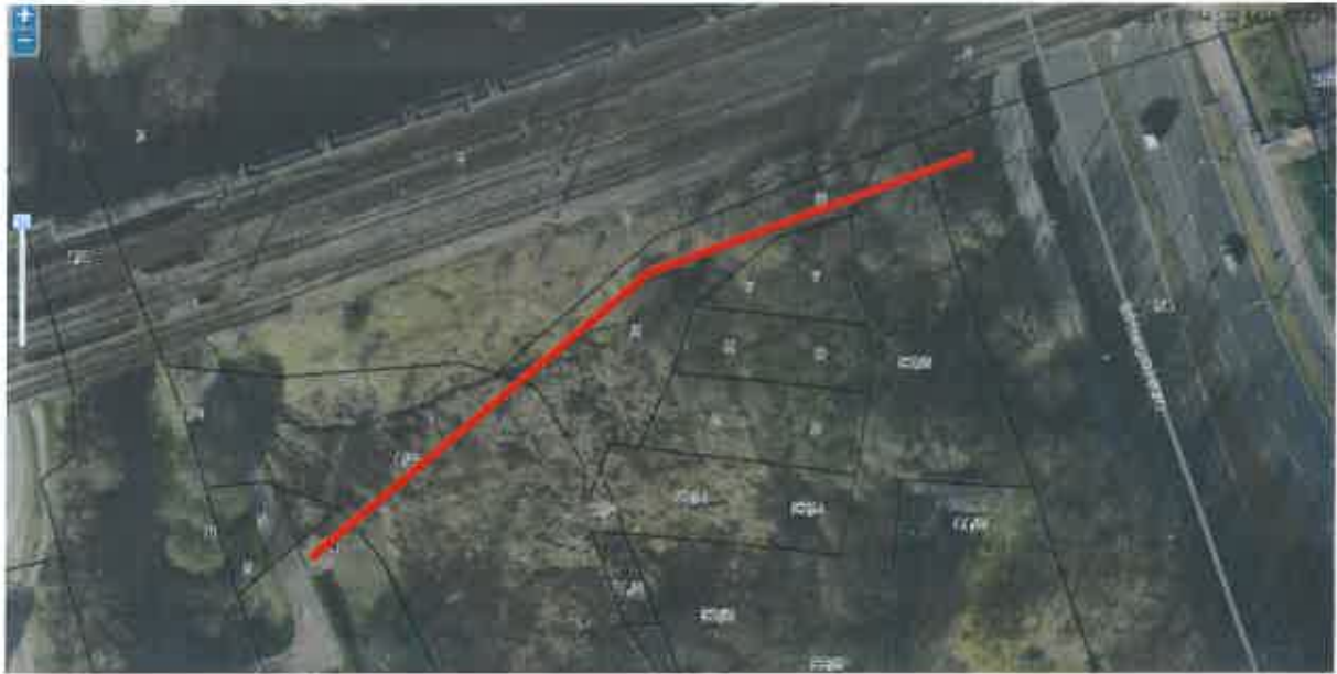
Rys. 1. Proponowany przebieg ciągu pieszo-rowerowego w dolinie rzeki Bystrzycy (na podstawie http://geoportal2.lublin.eu )