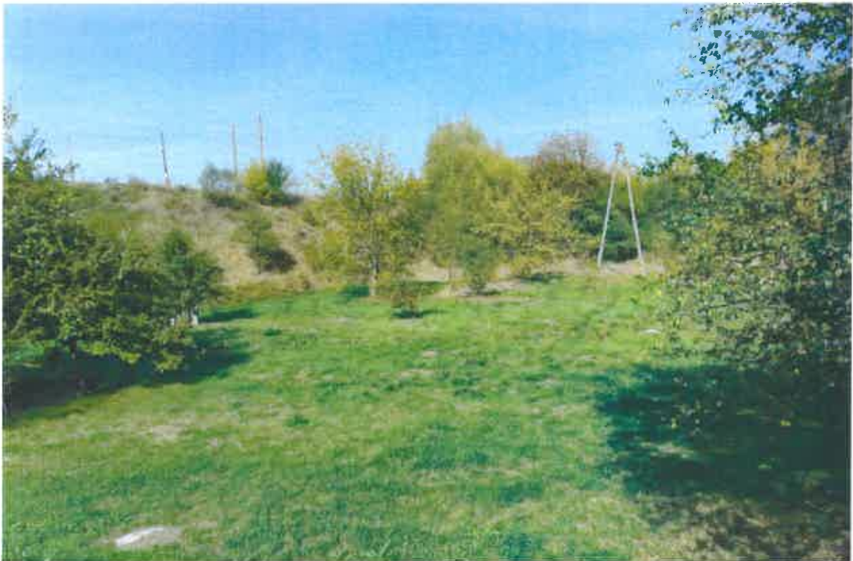
Fot. 1. Widok na działkę nr 1/2, arkusz 1, obręb 43 od strony rzeki Bystrzycy.