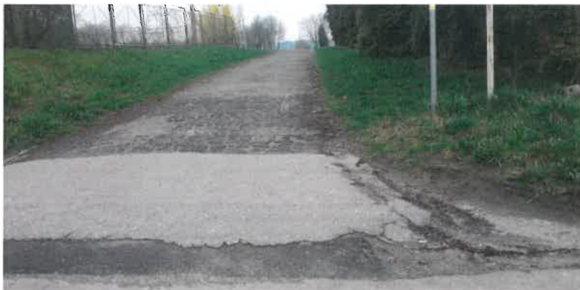
Fot. 1. Zniszczona aleja łącząca ulicę Żeglarską i Kazimierza Bryńskiego

obecnemu oznakowaniu trudno jest stwierdzić, którym pasem mają poruszać się rowerzyści i piesi. Pokładając głęboką nadzieję na szybkie wykonanie remontów ww. ciągów pieszych, jak również wymalowanie nowych pasów rowerowych (być może szerszych niż obecnie) zwracam się z prośbą o intensyfikację prac związanych z miejscowym planem zagospodarowania przestrzennego wokół Zalewu Zemborzyckiego.