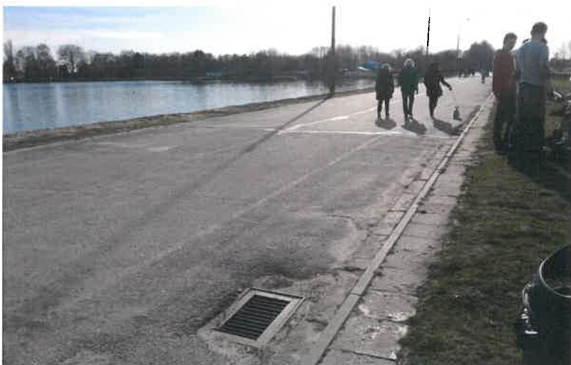
Fot. 2. Zniszczone pasy rozdzielające ruch pieszych i rowerowy na ulicy Kazimierza Bryńskiego