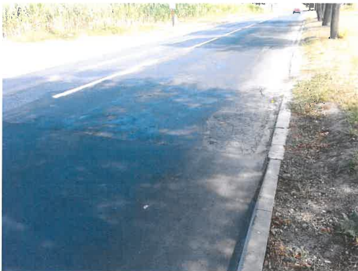
Fot. 1. Połączenie starej i nowej nawierzchni ulicy Żeglarskiej – stan na dzień 24 sierpnia 2015 r.