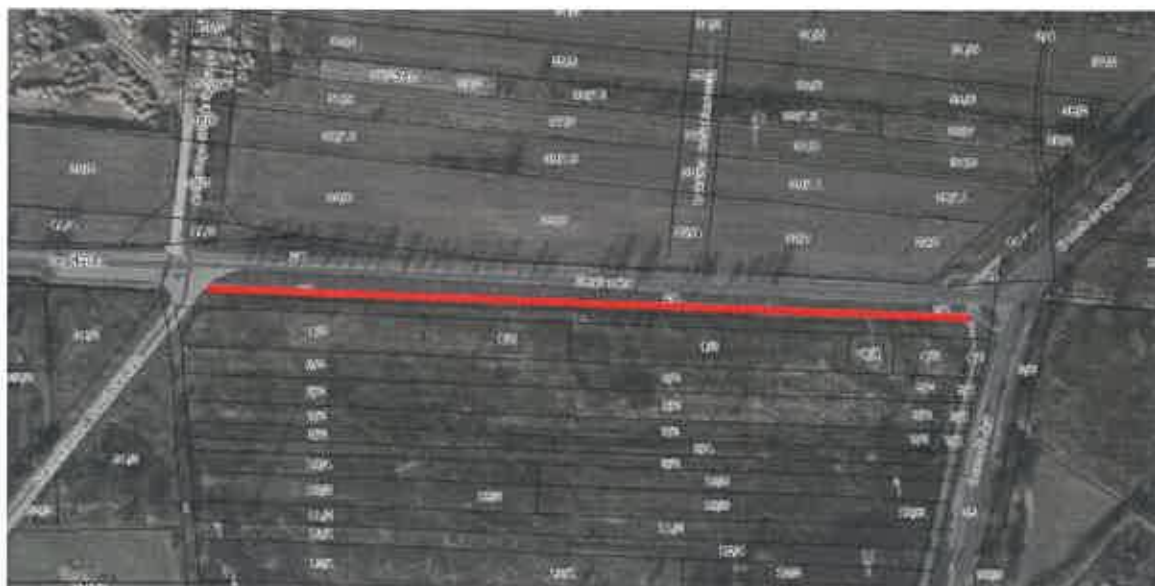
Rys. 2. Ulica Żeglarska z zaznaczonym odcinkiem chodnika umożliwiającym wykonanie ścieżki rowerowej.