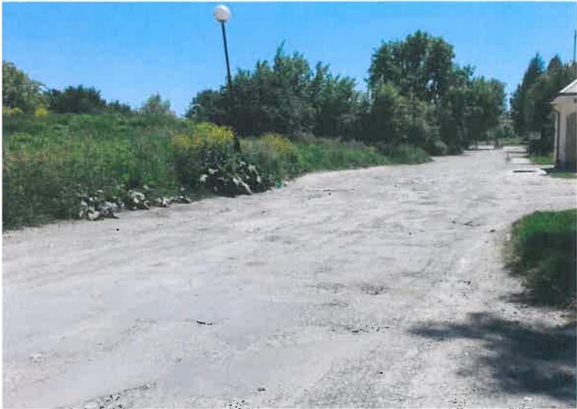
Rys. 1. Końcowy odcinek ulicy Jana Samsonowicza – działka nr 129/10, arkusz 24, obręb 43).

Do momentu wykonania dokumentacji i zarezerwowania odpowiednich środków finansowych na przebudowę mocno wskazany jest wykonanie częściowego remontu tej ulicy, głównie na ostatnim odcinku działki nr 129/10 (ok. 60m b.). Wyłożenie destruktem tego fragmentu ulicy, przy sprzyjających, wysokich temperaturach tymczasowo zaspokoi najpilniejsze potrzeby.