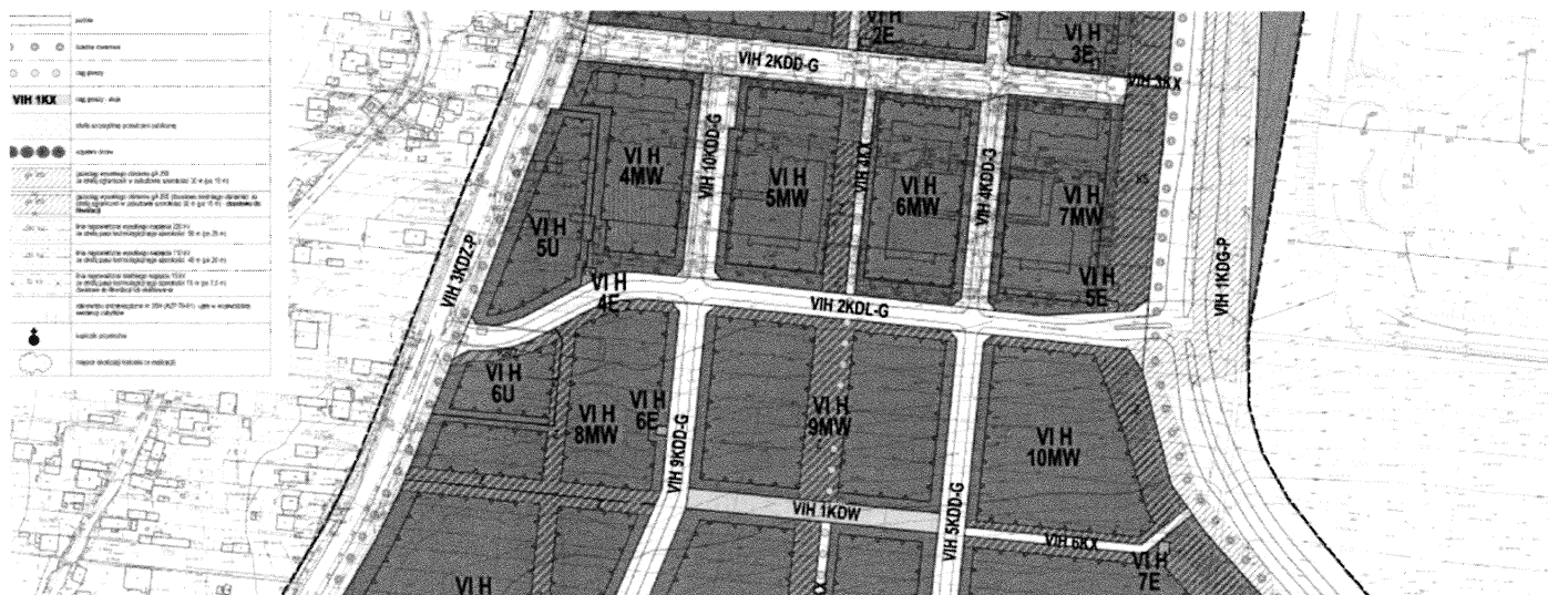
Rys. 1. Wycinek MPZP część VIH Wrotków Południowy – Osiedle Słoneczny Dom

W przyjętej uchwale Rady Miasta Lublin nr 550/XXIII/2012 z dnia 6 września 2012 r. ulica Jacka Woronieckiego oznaczona symbolem VIH 2KDL-G łączy ulicę Nałkowskich i przyszlą ul. Franciszka Uhorczaka. Aktualnie wybudowany odcinek do ulicy A. Słomkowskiego umożliwia jednak obsługę komunikacyjną dla względnie niewielkiego obszaru, a cały ruch z ulicy Łukasza Rodakiewicza wyprowadzany jest przez nadmiernie obciążoną ulicę bp. Mariana Fulmana. Budowa i zasiedlenie nowych bloków w tej okolicy niewątpliwie uzasadnia połączenie ulic Słomkowskiego i Rodakiewicza (odcinek o długości 160 mb – rys.1).