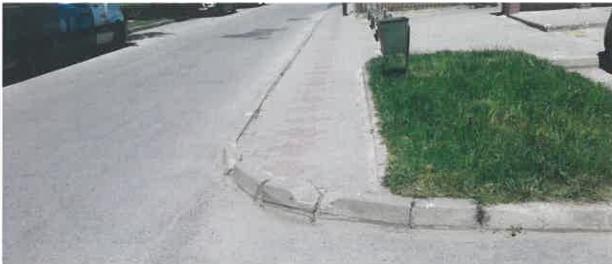
Rys. 1. Wysoki krawężnik kończący chodnik przy wjeździe na parking – działka nr 129/13, arkusz 24, obręb 43 (pas drogowy ulicy Nałkowskich).