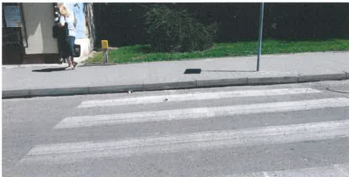
Rys. 2. Wysoki krawężnik przy przejściu dla pieszych na wysokości sklepu „Ryjek” – działka nr 125/18, arkusz 10, obręb 43 (pas drogowy ulicy Nałkowskich).