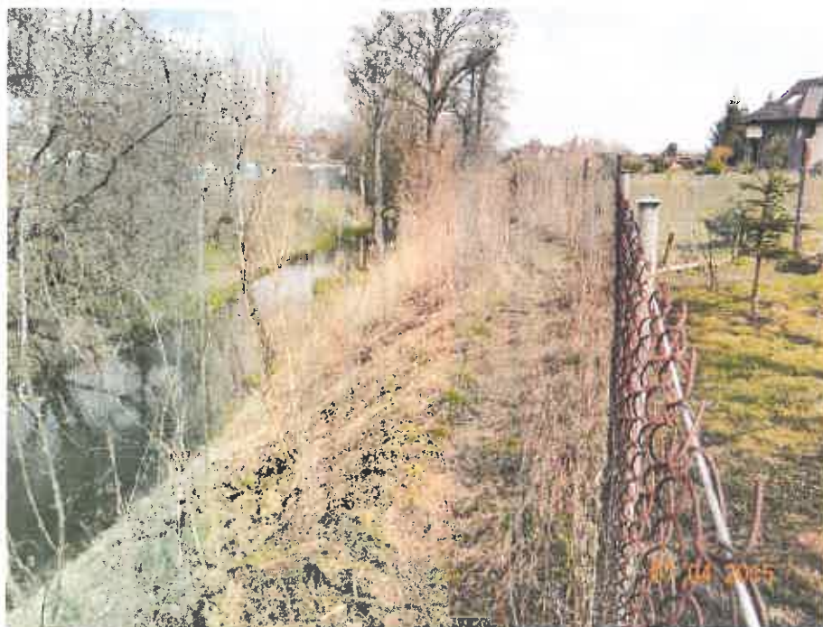
Fot. 1. Koryto rzeki Czerniejówki.

Pokładam głęboką nadzieję, iż opracowane odpowiedzi na powyższe pytania rozwieją dotychczasowe wątpliwości mieszkańców, a opracowany przez kompetentnych pracowników Wydziału Planowania dokument będzie spełniał jak najwyższe standardy i przysłuży się do rozwoju tej dzielnicy. Mając również na uwadze duże zainteresowanie mieszkańców tą sprawą zwracam się z prośbą o bardzo wnikliwą analizę dołączonego do niniejszej interpelacji pisma i przekazanie udzielonej odpowiedzi.