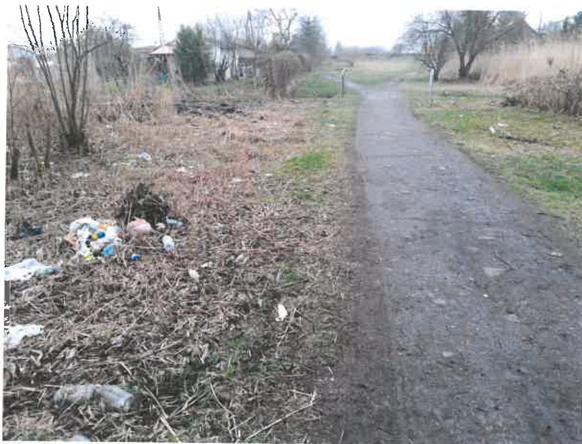
Fot. 1. Zalegające śmieci wzdłuż ciągu pieszego będącego przedłużeniem ulicy Rąblowskiej – stan na dzień 01.04.2016 r.

Biorąc pod uwagę ilość zalegających śmieci (przy systematycznym sprzątaniu tego terenu) zwracam się z prośbą o monitorowanie tego przejścia przez piesze i rowerowe patrole Policji celem poprawy estetyki i bezpieczeństwa w tym miejscu.