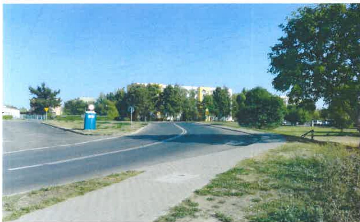
Fot. 2. Widok na nieoświetlony odcinek ulicy Romera.