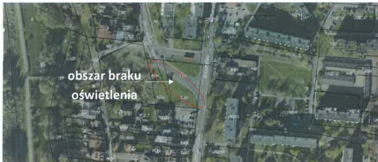
Fot. 1. Obszar braku oświetlenia na ulicy Romera (na podstawie http://geoportal.lublin.eu/ ).

Pokładamy głęboką nadzieję, że dokładna analiza przedstawionego powyżej problemu, uzupełniona dodatkowymi informacjami przez kompetentnych pracowników lubelskiego Zarządu Dróg i Mostów przyczyni się do zwiększenia bezpieczeństwa w ruchu drogowym w tej okolicy.