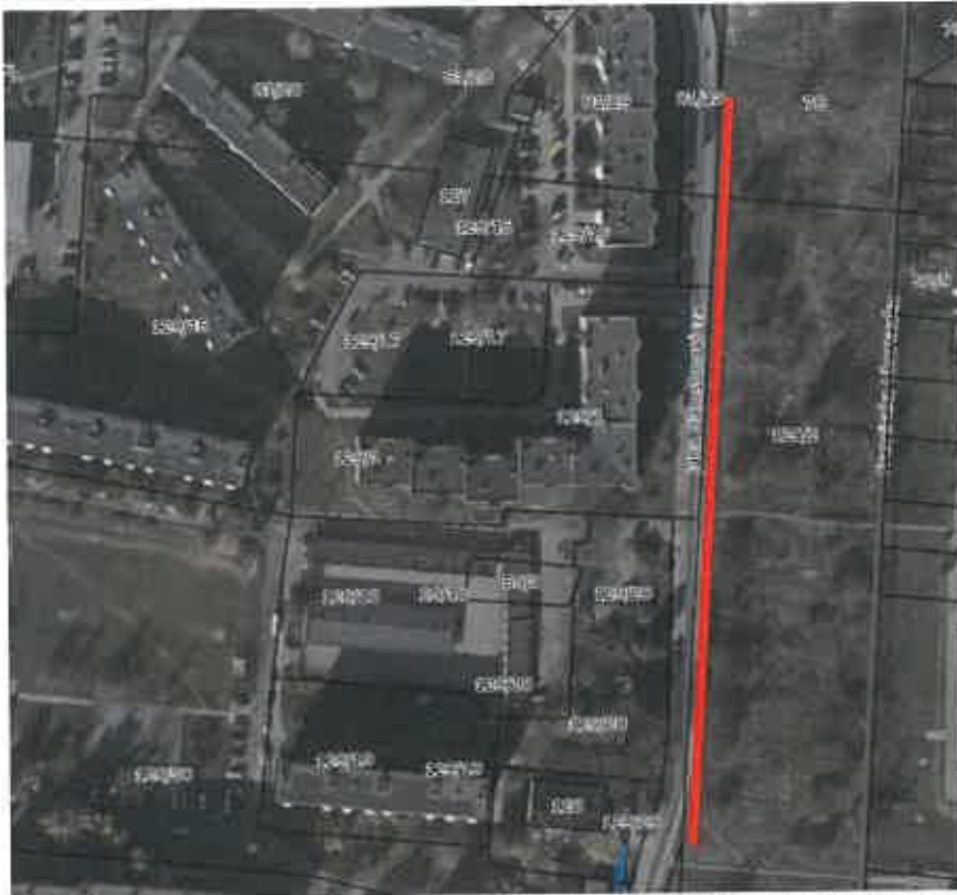
Rys. 1. Proponowane miejsca parkingowe wzdłuż ulicy Jana Samsonowicza