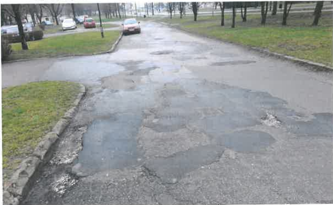
Fot. 2. Brak chodnika w pasie drogowym w pobliżu nieruchomości Samsonowicza 11.