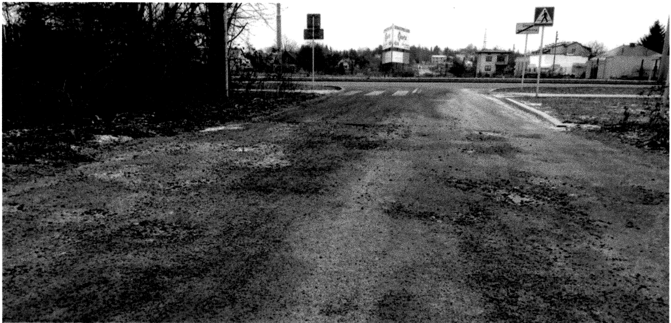
Rys. 1. Ubytki w nawierzchni ulicy Makowej

Biorąc pod uwagę projekt budżetu na rok przyszły, który dotychczas nie zawierał zapisów budowy ulicy Makowej proszę o rozważenie możliwości ujęcia tego zadania w ramach wprowadzanych comiesięcznie zmian w uchwale budżetowej.