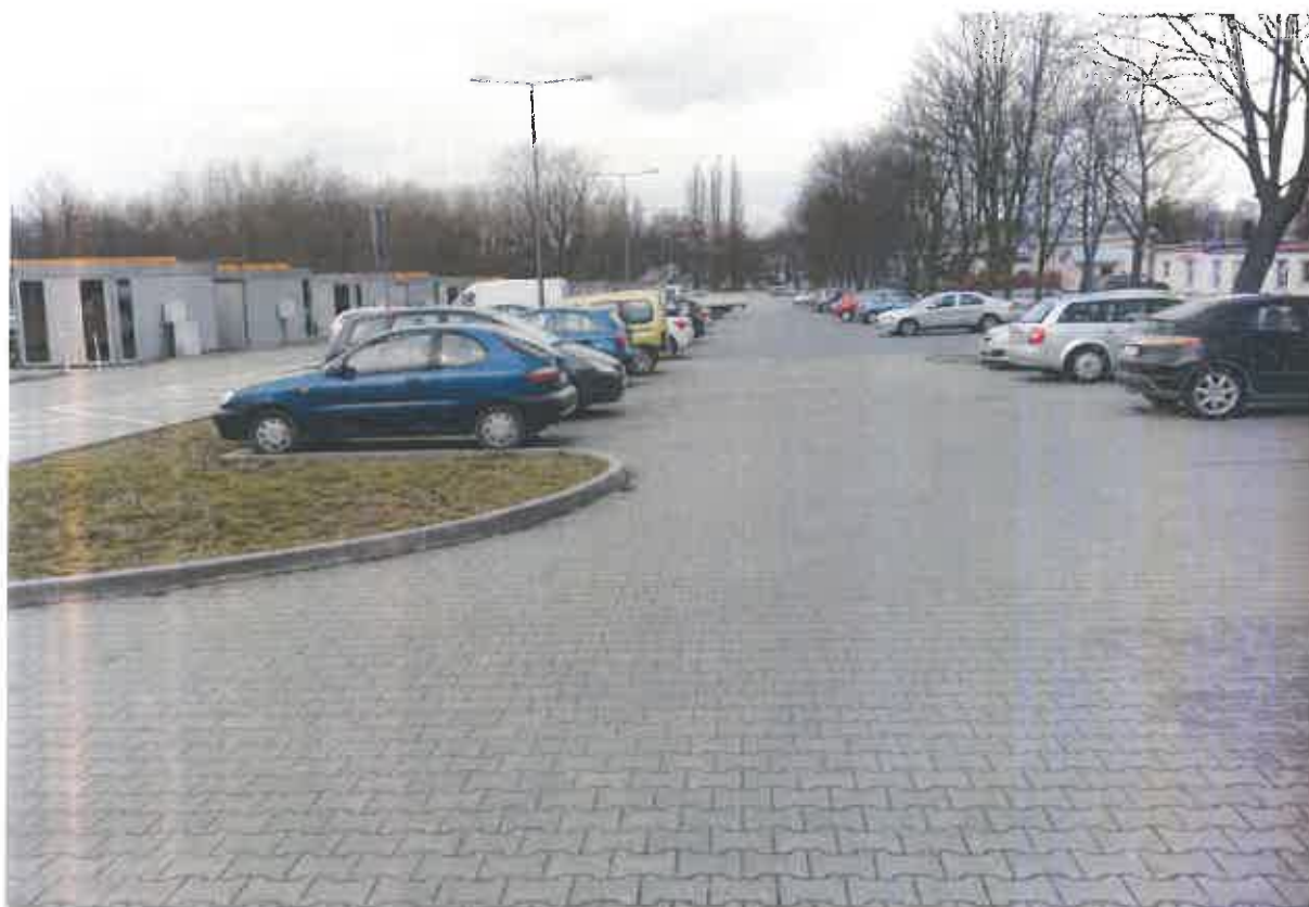
Fot. 3. Parkingi w pobliżu cmentarza.