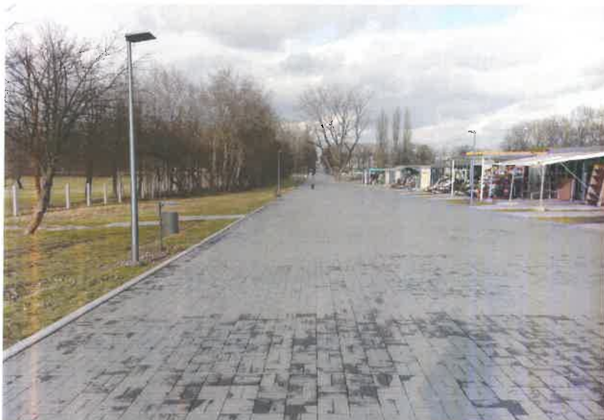
Fot. 2. Dojście do głównej bramy cmentarza.