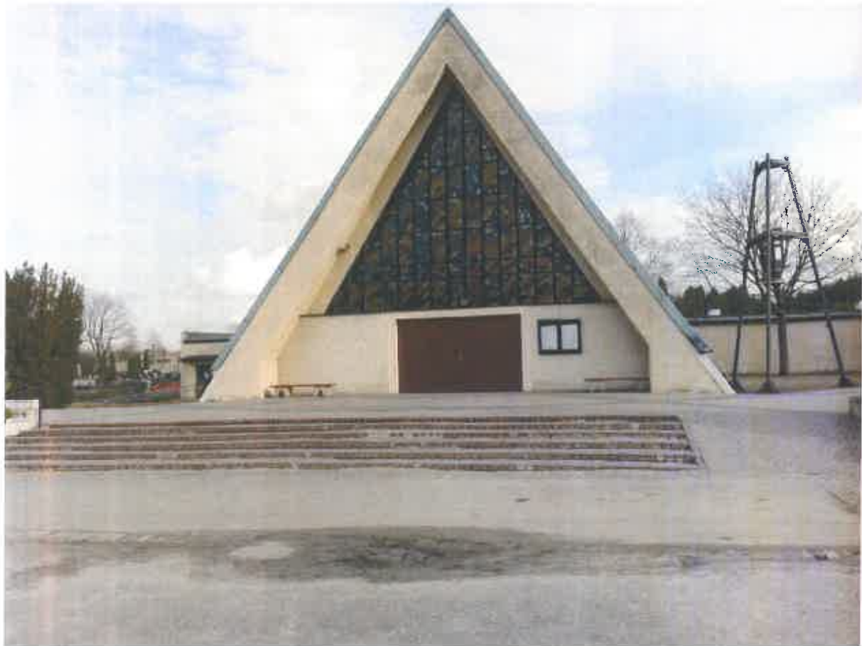
Fot. 1. Kaplica pogrzebowa na terenie cmentarza na Majdanku.