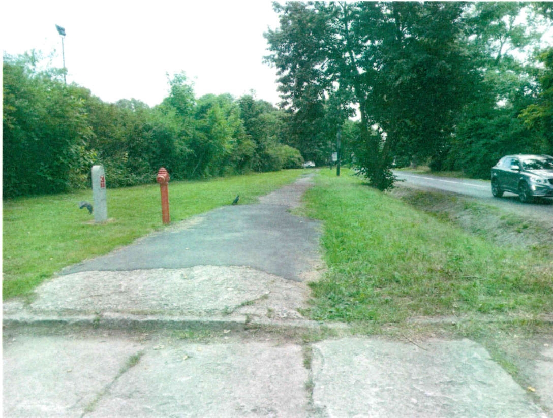
Rys. 1. Propozycja lokalizacji piłkochwyłów wzdłuż chodnika.