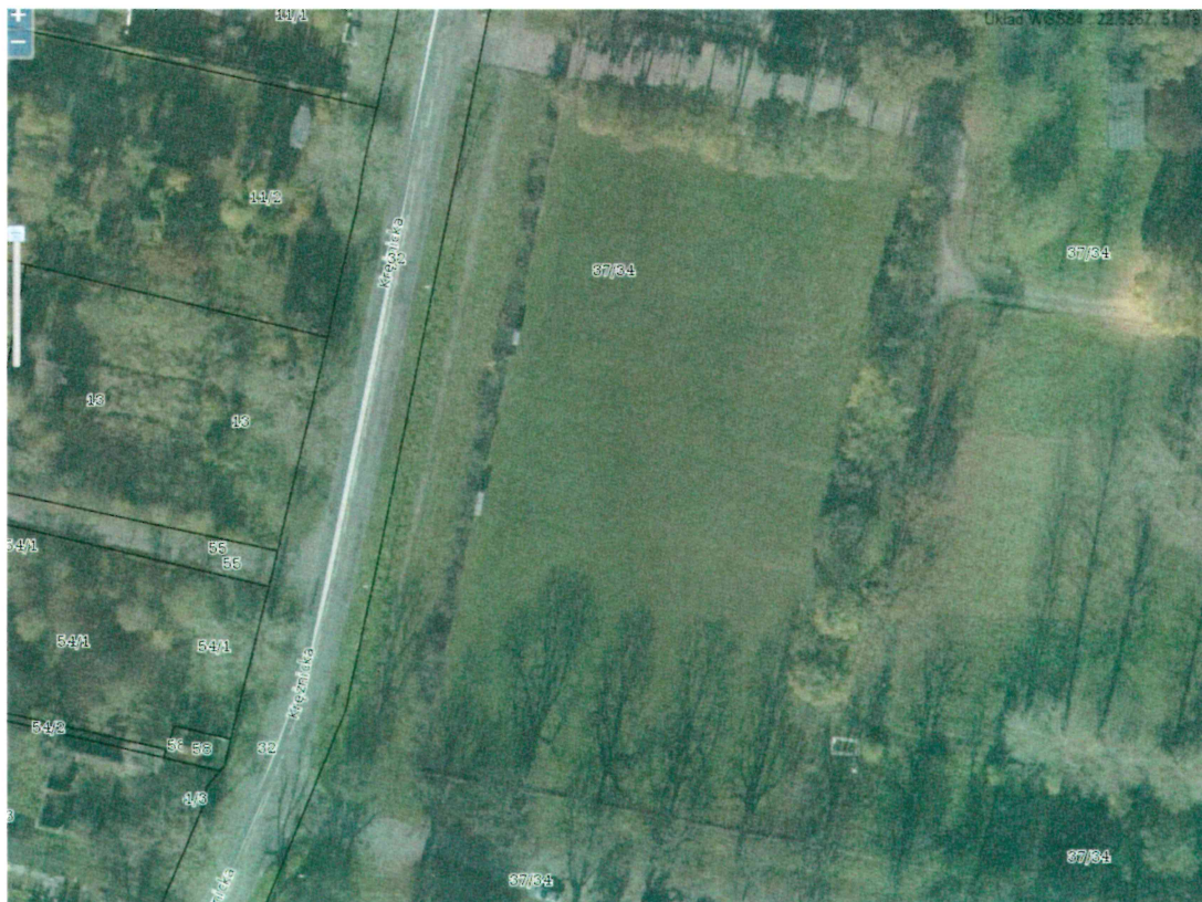
Rys. 2. Podział geodezyjny nieruchomości w pobliżu boiska (na podstawie http://geoportal2.lublin.eu/ ).