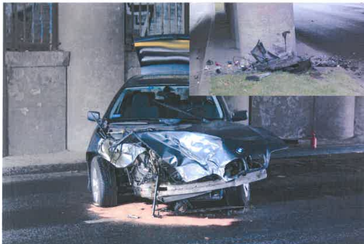
Fot. 2. Wypadek na ulicy Diamentowej w dniu 09.11.2014 ( http://www.lublin112.pl/ul-diamentowa-bmw-uderzylo-filar-wiaduktu-kierowca-trafil-szpitala-zdjecia/ )