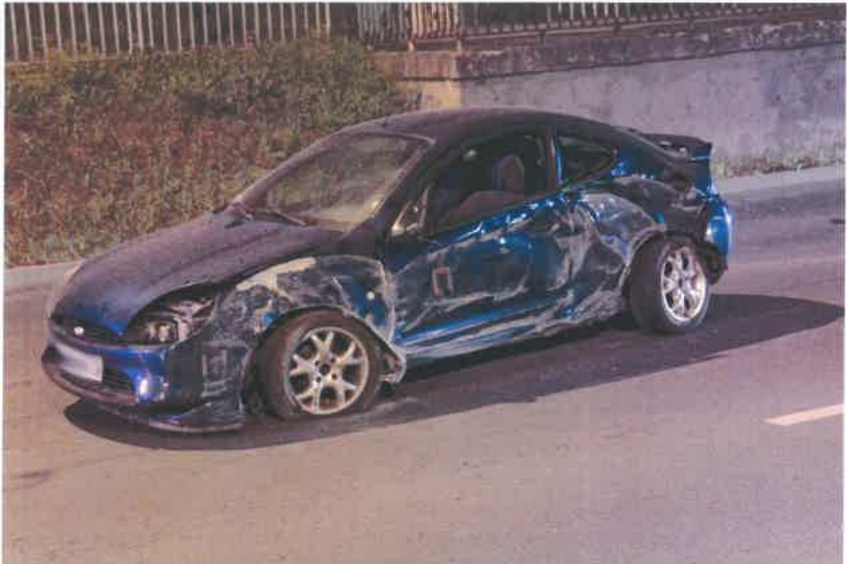
Fot. 3. Wypadek na ulicy Diamentowej w dniu 11.08.2014 ( http://www.lublin112.pl/ul-diamentowa-ford-uderzyl-wiadukt-kierowca-trafil-szpitala-zdjecia/ )