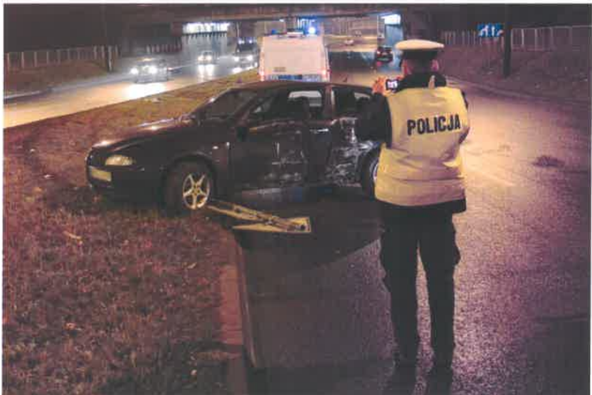
Fot. 4. Wypadek na ulicy Diamentowej w dniu 21.10.2014 ( http://www.lublin112.pl/ul-diamentowa-wypadl-zakrecie-wjechał-prad-scial-znaki-kierowca-trafil-szpitala-zdjecia )