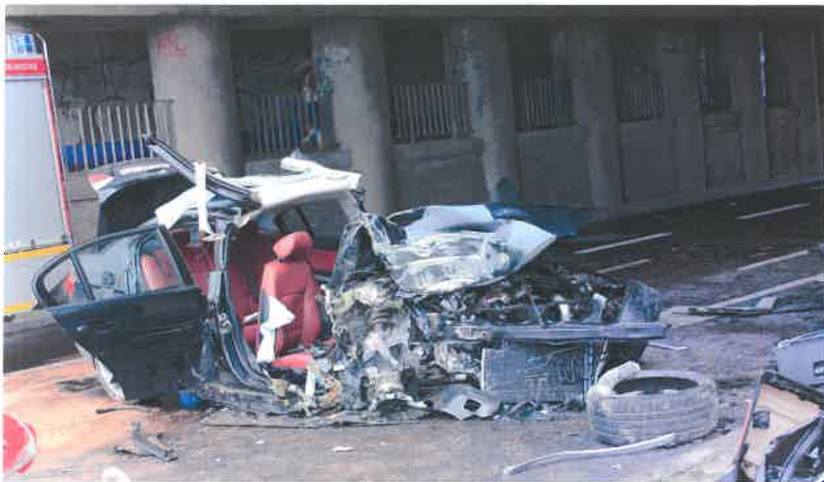
Fot. 1. Wypadek ze skutkiem śmiertelnym na ulicy Diamentowej w dniu 12.08.2014 ( http://www.lublin112.pl/ul-krochmalna-bmw-roztrzaskalo-sie-wiadukcie-zyje-pasazer-zdjecia/ )