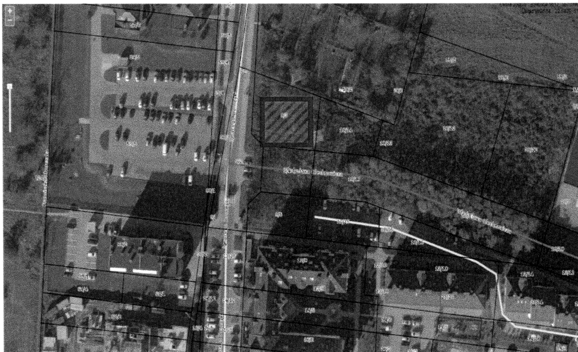
Rys. 1. Lokalizacja przyszłej myjni samochodowej na działce nr 9/3, arkusz 25, obręb 43.