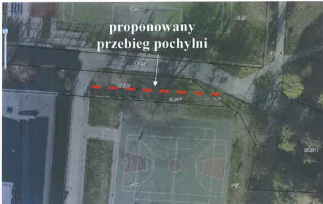
Fot. 1. Proponowany przebieg pochylni dla niepełnosprawnych na działce nr 81/37, arkusz 20, obręb 43 (na podstawie http://geoportal.lublin.eu/ ).