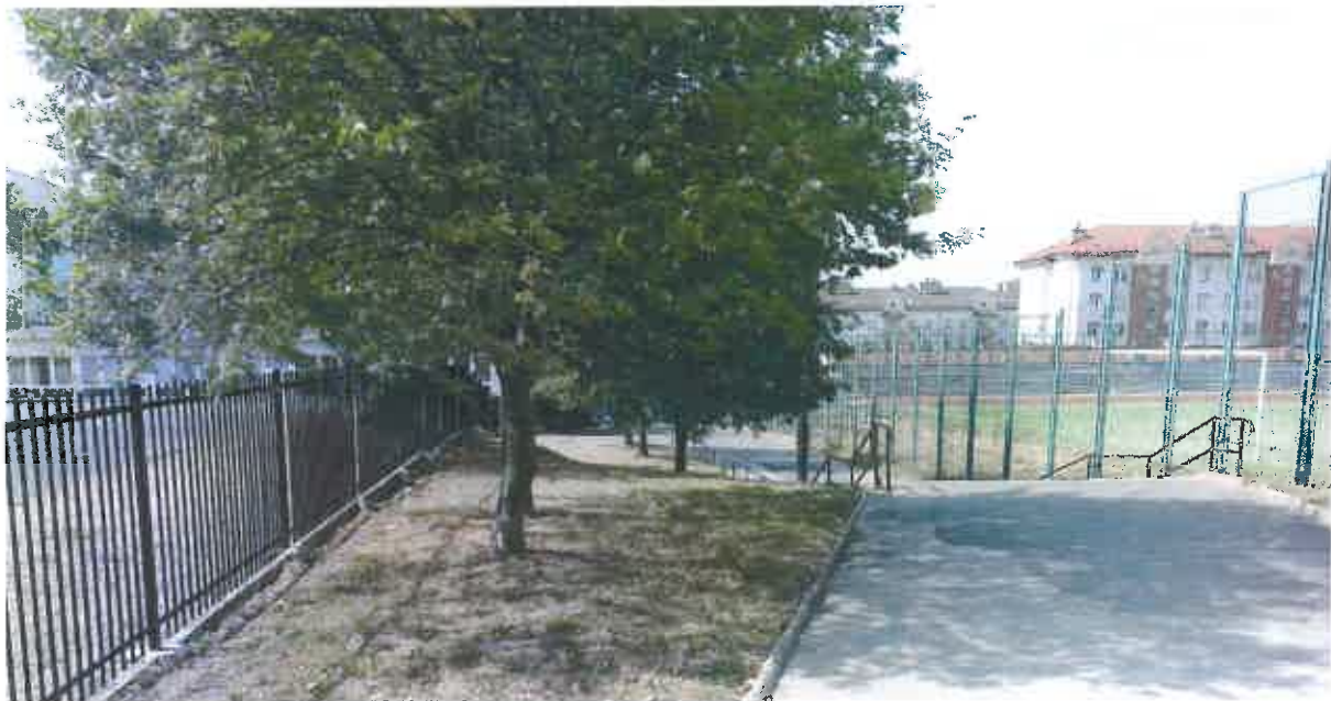
Fot. 2. Widok na działkę nr 81/37 od strony ulicy Samsonowicza.