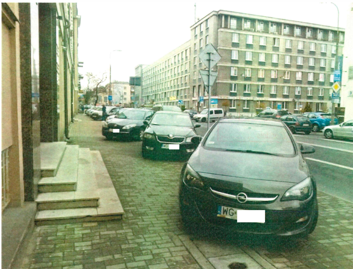
Rys. 1. Samochód utrudniający przejście na ulicy Okopowej (fot. z dnia 13.04.2017 r.).