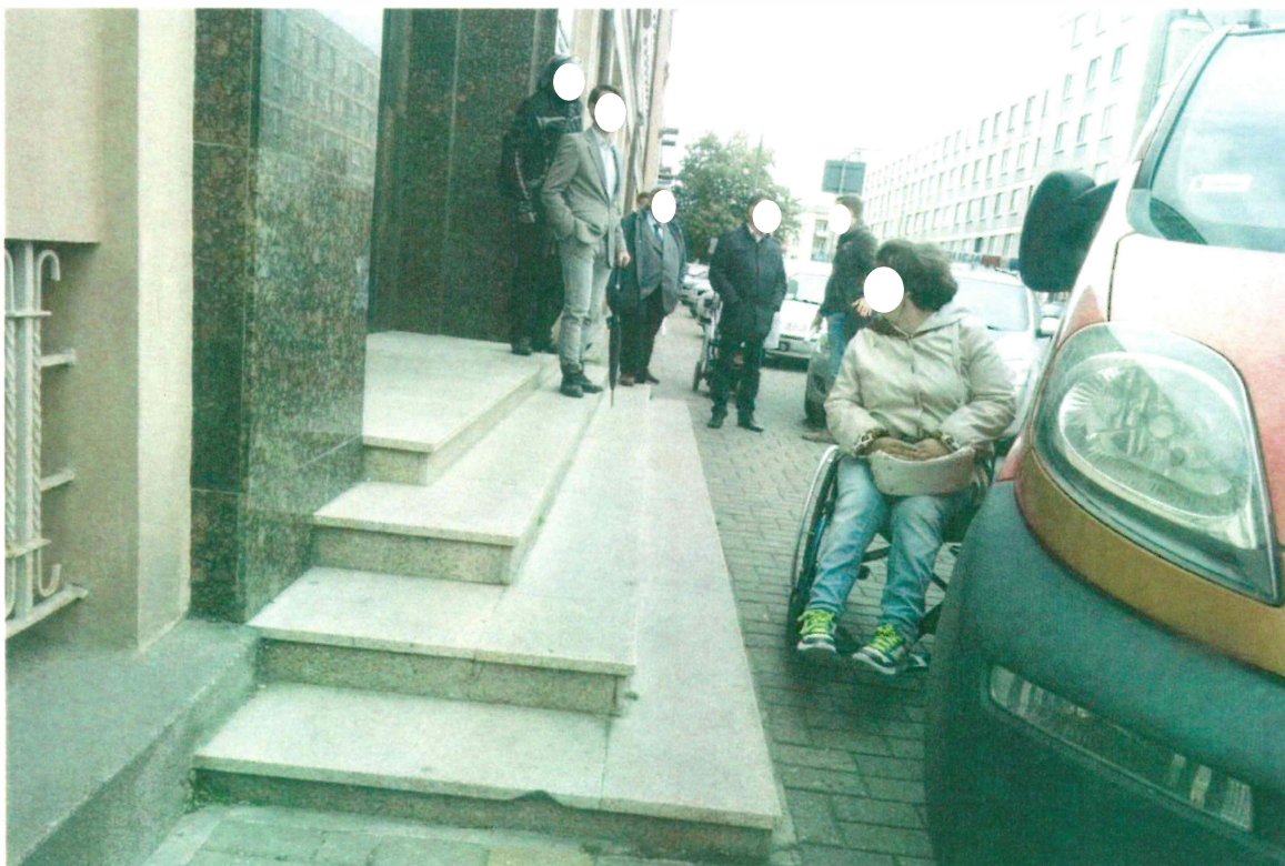
Rys. 4. „Spacer z przeszkodami” w dniu 22 września 2016 r.

http://www.dziennikwschodni.pl/galeria.html?gal=999675344&art=1000187028&f=7