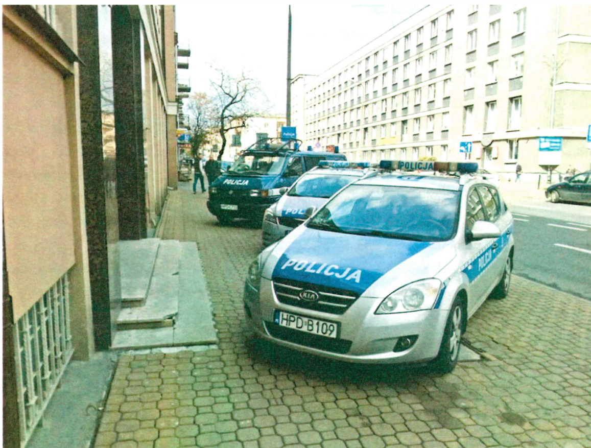
Rys. 2. Samochód utrudniający przejście na ulicy Okopowej (fot. z dnia 11.04.2017 r.).