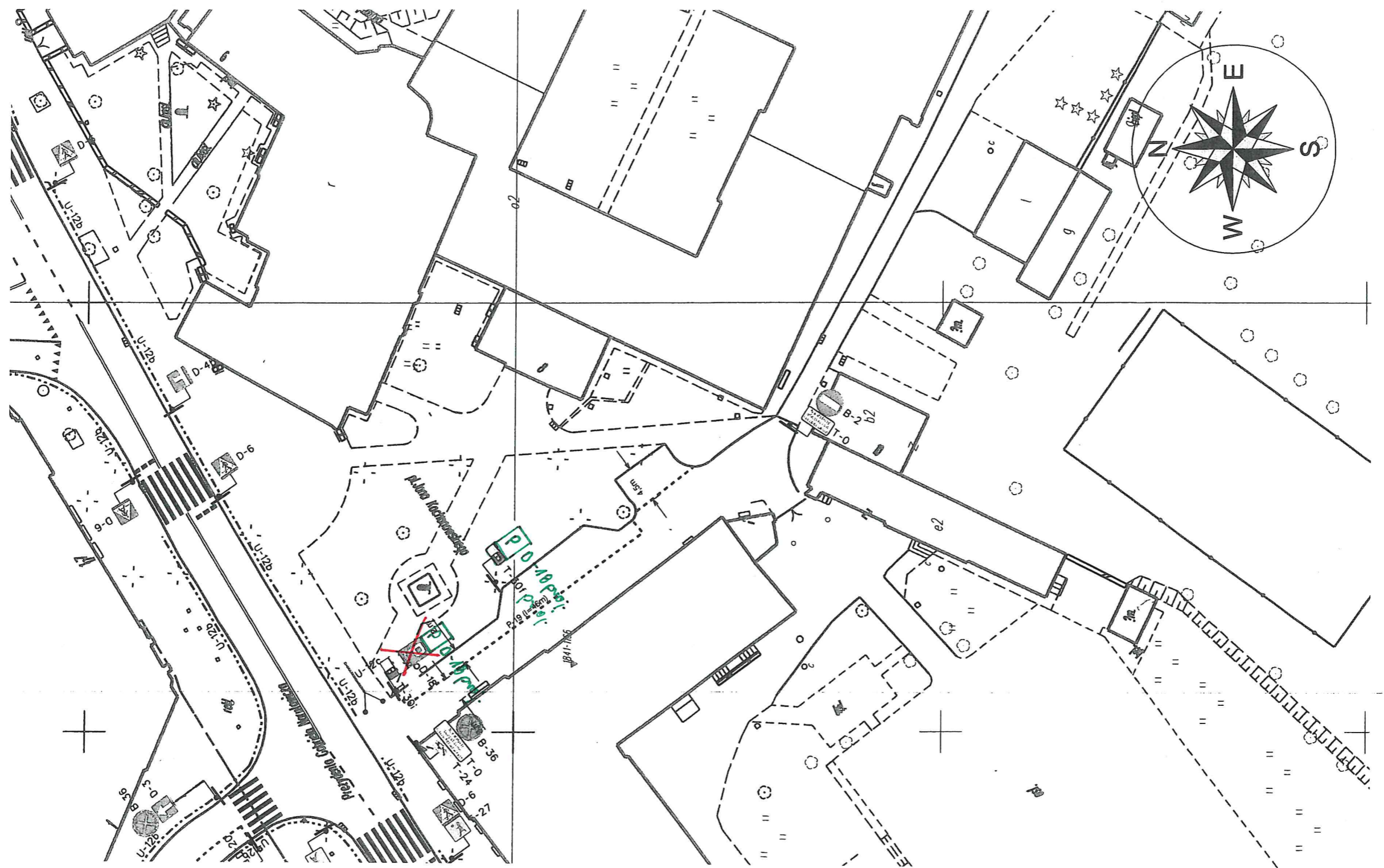
Rys. 3 Projekt stajiej organizacji wulnu Skala 1: 500