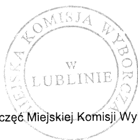
(pieczęć Miejskiej Komisji Wyborczej)

[Handwritten signatures of the members of the Municipal Election Commission]