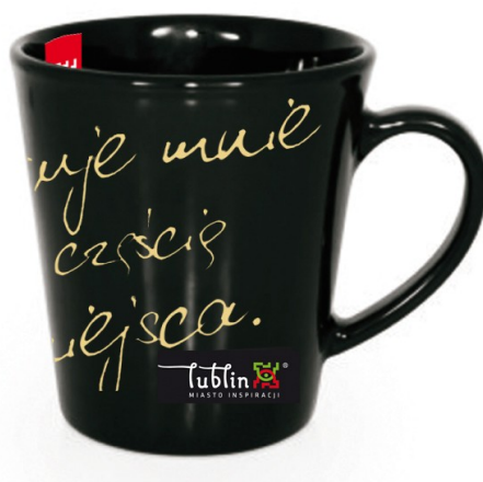
nadruk wewnątrz kubka